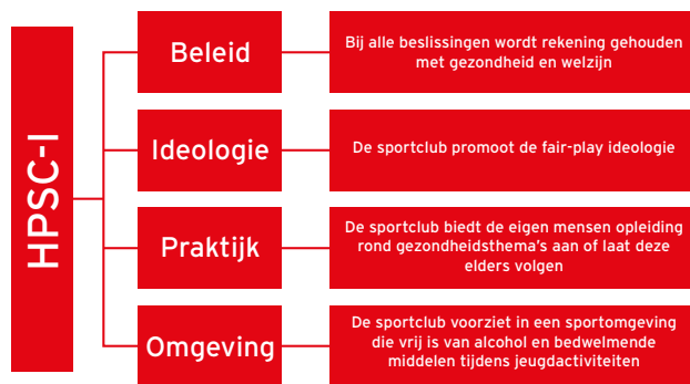
Figuur 1. Trendanalyse met betrekking tot gezondheids promotie in sportclubs in Vlaanderen in 2011, 2012 en 2015 op basis van de Health Promoting Sport Club Index (HPSC-I) en de verschillende sub-indices (beleids-, ideologie-, praktijk- en omgevingsindex)

Universiteit Leuven voerde in samenwerking met de Vlaamse Gemeenten en de Vlaamse Gemeenschapscommissie een onderzoek uit waarbij sportclubs bevestigd werden naar hun visie op gezondheids promotie. Hierbij werd gebruik gemaakt van de Health Promoting Sports Club Index (HPSC-I). Dit instrument onderzoekt vier aspecten van gezondheids promotie binnen een sportclub, met name het beleid, de ideologie, de praktijk en de omgeving. Verder wordt ook een globale score gegeven, de HPSC-I.